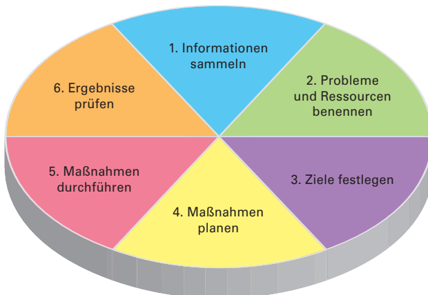
Abb. 2: Der Pflegeprozess in sechs Schritten.

... der vierschrittige Pflegeprozess nicht. Auch die WHO verwendet ihn.